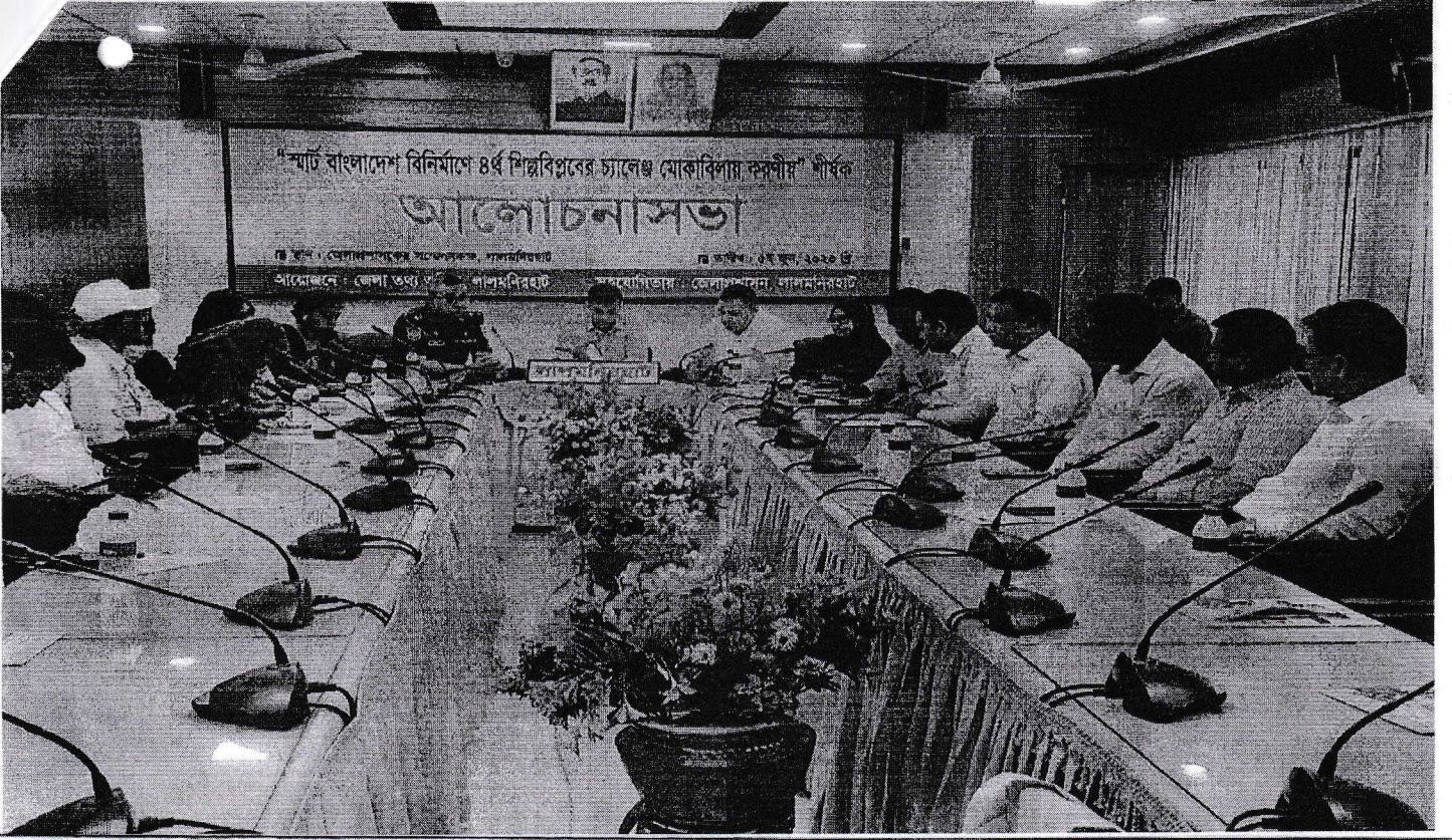
“স্মার্ট বাংলাদেশ বিনির্মাণে ৪র্থ শিল্প বিপ্লবের চ্যালেঞ্জ মোকাবিলায় করণীয়” শীর্ষক আলোচনাসভা, স্থান: জেলা প্রশাসকের সম্মেলনকক্ষ, লালমনিরহাট, তারিখ: ০৫ জুন, ২০২৩ আয়োজনে: জেলা তথ্য অফিস, লালমনিরহাট, সহযোগিতায়: জেলা প্রশাসন, লালমনিরহাট।